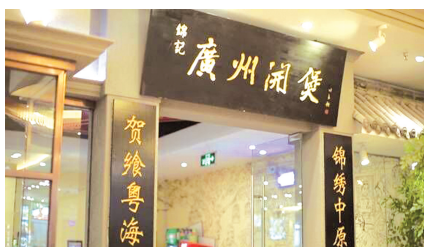
锦记广州开煲 专注粤菜20年

《开煲》广州地方特色小吃,俗称(打边炉)。至亲好友围坐路边,鸡鱼肉蔬同纳煲内,其香漫漫,其乐融融。《锦记》正宗广州开煲老店,深承粤商(诚信务实)之风,尽显羊城(容纳四海之味),彩色多而有精专,服务细而显谦诚。