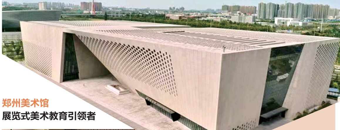
郑州美术馆 展览式艺术教育引领者